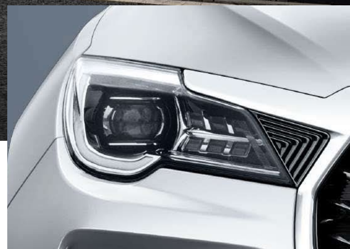
SISTEMA DE LUCES DIURNAS (DRL) LED