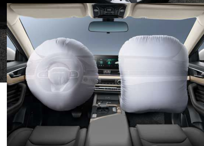
AIRBAGS FRONTALES, LATERALES Y DE CORTINA