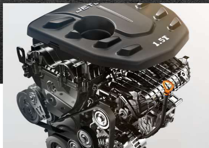
MOTOR 1.5 T TRANSMISIÓN: 6MT / 6DCT.