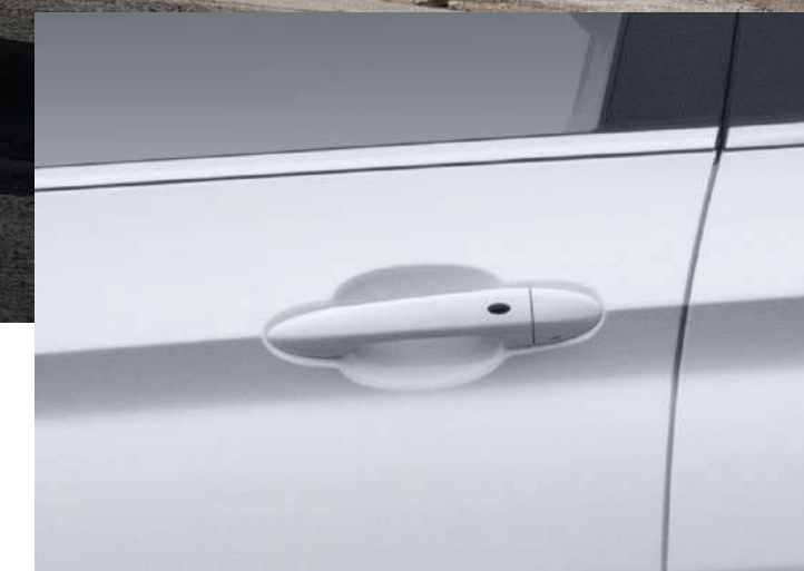
SISTEMA DE APERTURA Y CIERRE DE PUERTAS KEYLESS