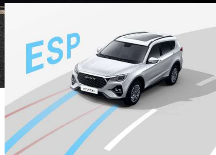
SISTEMA DE CONTROL DE ESTABILIDAD (ESP)